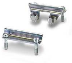
Adaptoreinsatz, Bauform: D15

Bitte beachten Sie, dass die in diesem PDF-Dokument angezeigten Daten aus unserem Online-Katalog generiert wurden. Bitte finden Sie die vollständigen Daten in der Benutzer-Dokumentation. Es gelten unsere Allgemeinen Nutzungsbedingungen für Downloads.