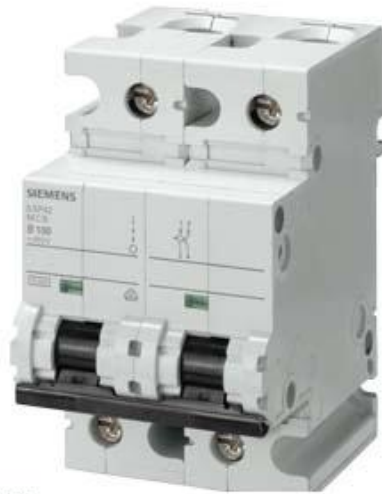
LEITUNGSSCHUTZSCHALTER 400V 10KA, 2-POLIG, C, 100A, T=70MM