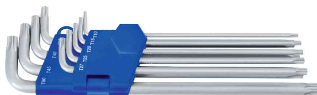
Jeu de clés mâles coudées Torx, longues