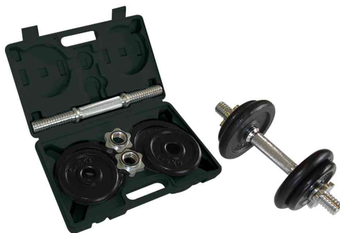
Haltère à barre courte, set de 10 kg, dans un coffret