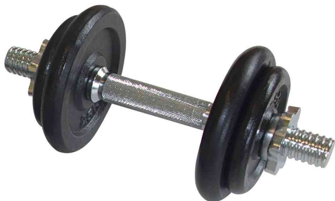
Haltère à barre courte