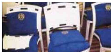
Dual Lock, Anwendungsbeispiele