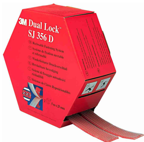
Dual Lock flexibler Druckverschluss SJ356D