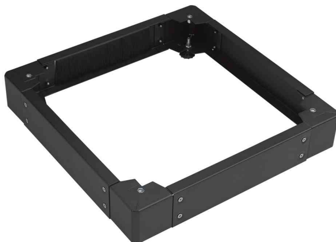
Sockel für 19" Serverschränke, schwarz