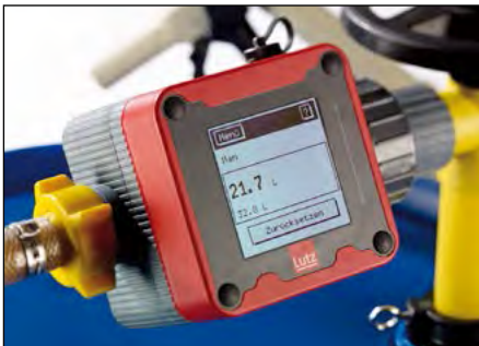
Durchflusszähler für Fass- und Containerpumpen.