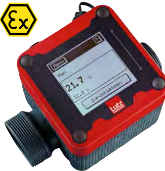
Durchflusszähler für Ex-Fasspumpen.