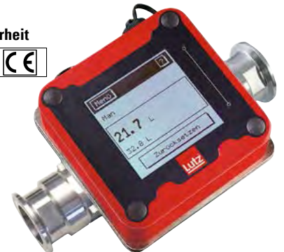
Durchflusszähler für Lebensmittelpumpen

Mehrpreis Relaismodul für Mengenvorwahl, nicht Ex-geschützte Version, Bestell-Nr. 121-590-63 Ex-geschützte Version auf Anfrage