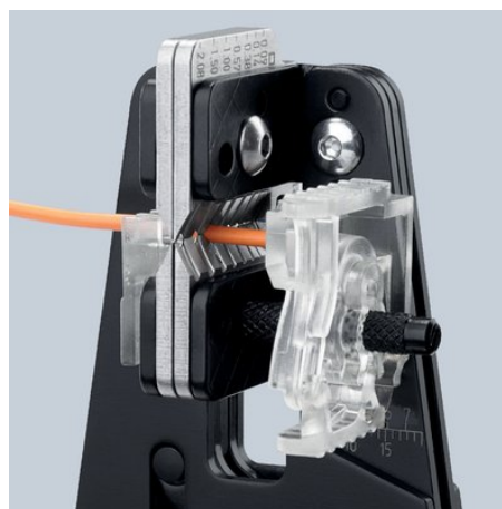
Corte preciso del aislante en toda su extensión