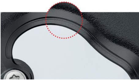
Precíziósan mart és induktilvan edzett vágóél