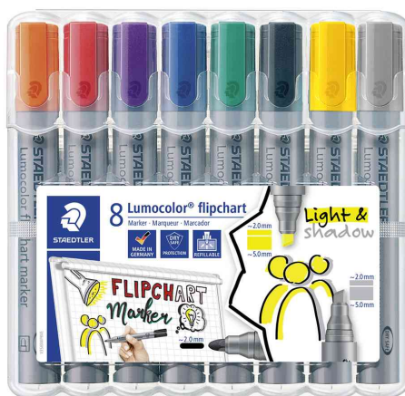
Marqueur de conférence Lumocolor 356 + 356 B, étui de 8