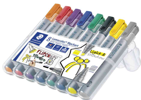
Marqueur de conférence Lumocolor 356 + 356 B, étui de 8