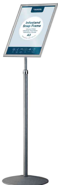
Porte-affiche avec cadre à clipser, télescopique