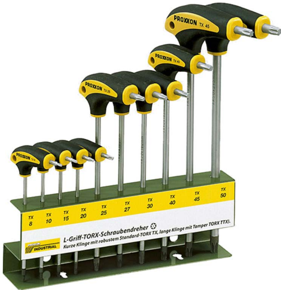
NO 22 652 10-teiliger L-Griff-TX-Satz mit Halter