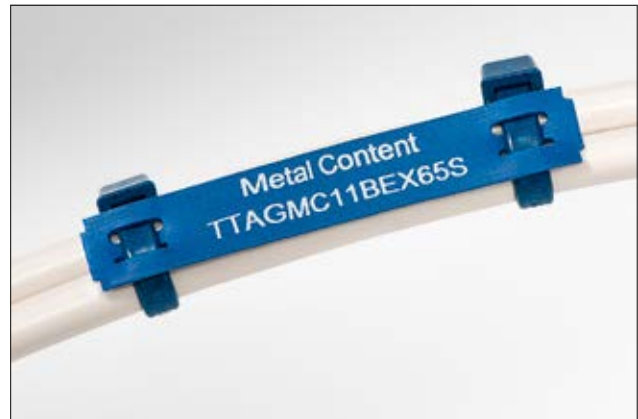
TIPTAG MC – metallhaltige Kennzeichnungsschilder für den sicheren und sauberen Produktionsprozess.