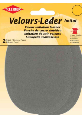
Patch imitation velours cuir, taupe