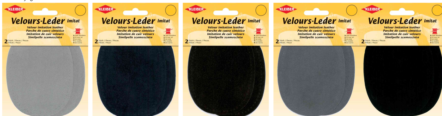
Patch imitation velours cuir, beige

lavage à la main jusqu'à 40 °C max., pas de javel, pas de séchage au sèche-linge, repassage possible position 1 ou jusqu'à une température maximale de 110°C, pas de nettoyage à sec