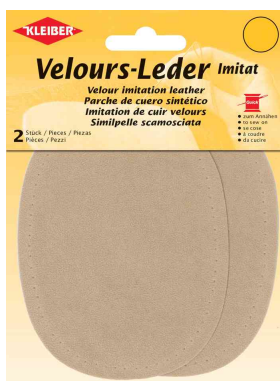
Patch imitation velours cuir, sable