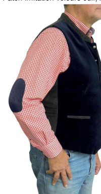
Visuel de référence: présente le produit en utilisation