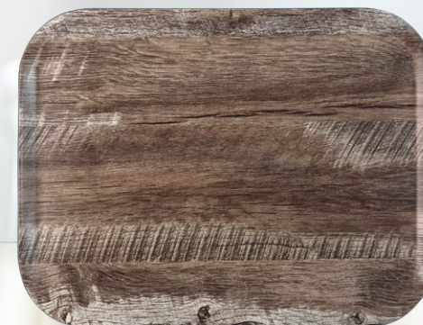
Sanoma Eiche H1935-368