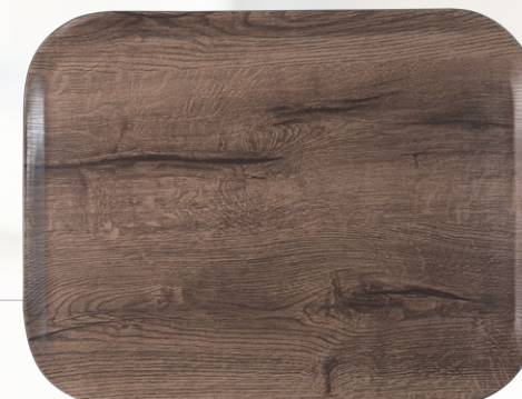
Buche Scandic dunkel H1935-376