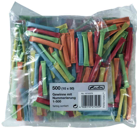
Billets-gagnants 1-500 (couleurs assorties)

Code. 791848001: pour le marché: D / L / A / CH