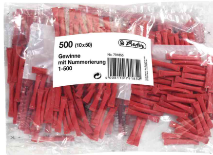
Billets-gagnants 1-500, rouge