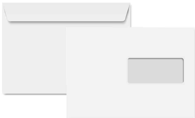
Enveloppe C5, avec fenêtre à droite