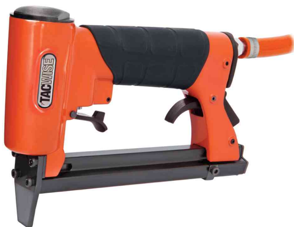
Agrafeuse pneumatique A8016V