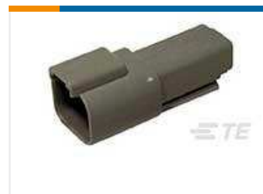
TE Teilnr.:DT04-2P REC, 2P, GRY, N