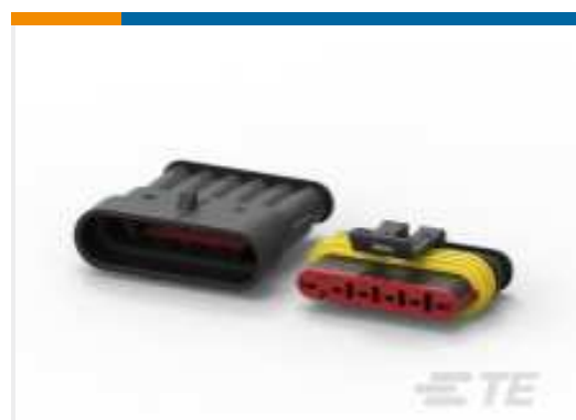
TE Teilnr.:282104-1 AMP SUPERSEAL 1.5MM, STECKVERBINDERGEHÄUSE