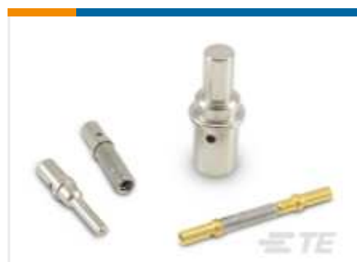
TE Teilnr.:0460-202-16141 DEUTSCH Kontakte