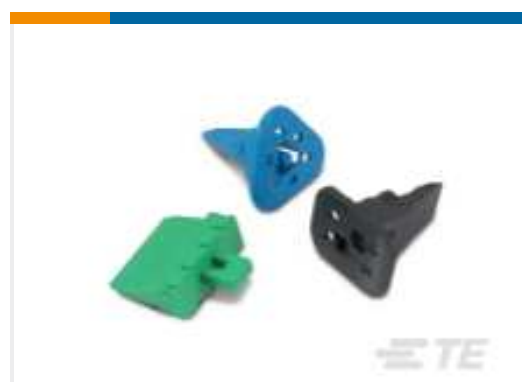
TE Teilnr.:W2S DEUTSCH DT Keilschlösser