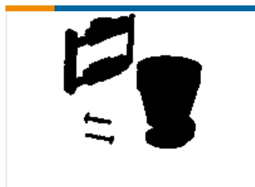
TE Teilnr.:206070-8 CABLE CLAMP KIT #17