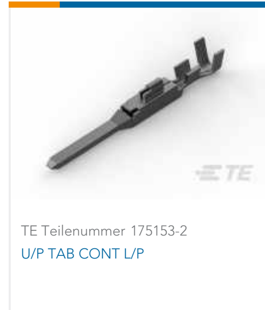
TE Teilenummer 175153-2 U/P TAB CONT L/P