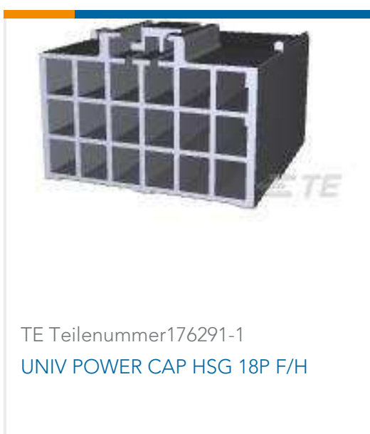
TE Teilenummer 176291-1 UNIV POWER CAP HSG 18P F/H