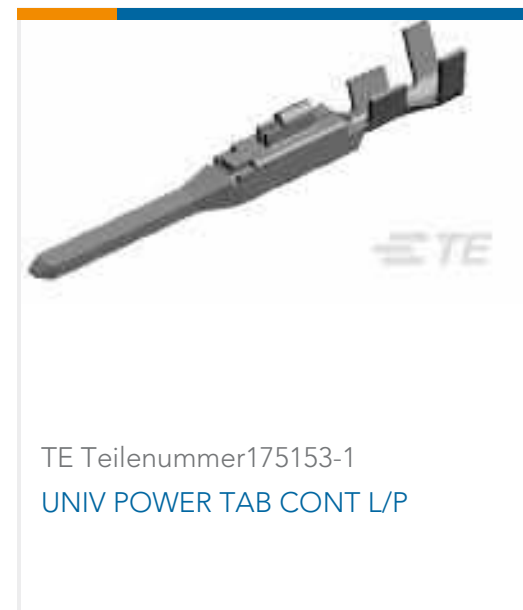
TE Teilenummer175153-1 UNIV POWER TAB CONT L/P