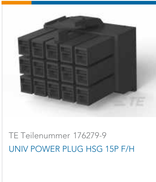
TE Teilenummer 176279-9 UNIV POWER PLUG HSG 15P F/H