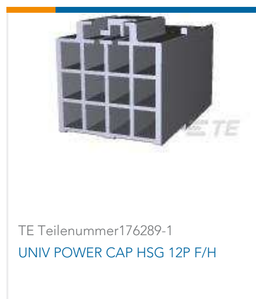
TE Teilenummer 176289-1 UNIV POWER CAP HSG 12P F/H