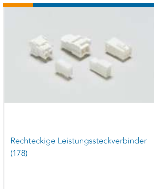
Rechteckige Leistungssteckverbinder (178)