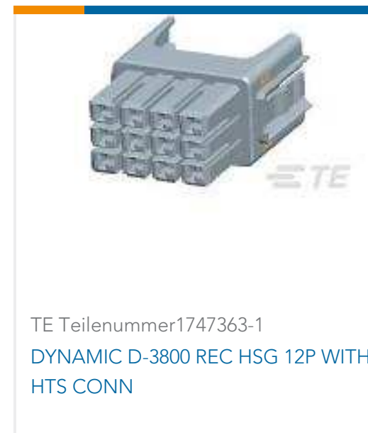
TE Teilenummer1747363-1 DYNAMIC D-3800 REC HSG 12P WITH HTS CONN