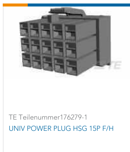
TE Teilenummer 176279-1 UNIV POWER PLUG HSG 15P F/H