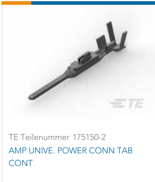
TE Teilenummer 175150-2 AMP UNIVE. POWER CONN TAB CONT