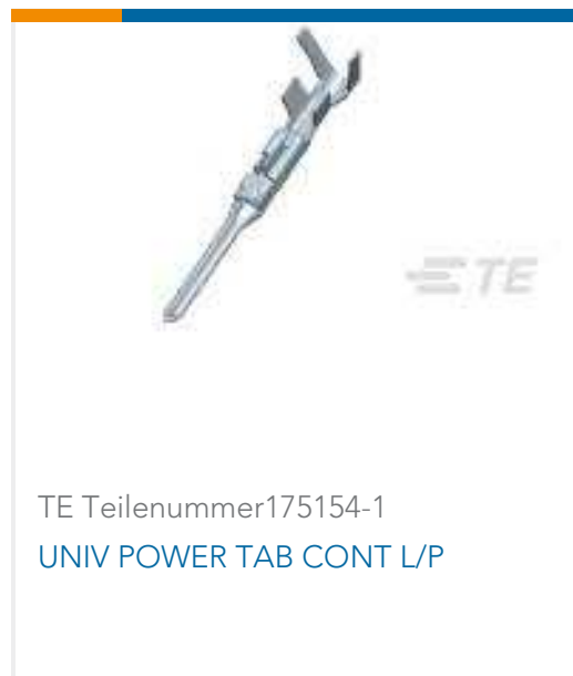
TE Teilenummer175154-1 UNIV POWER TAB CONT L/P