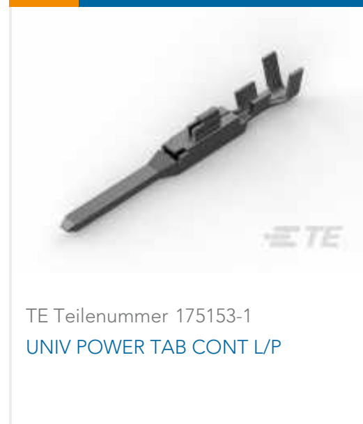
TE Teilenummer 175153-1 UNIV POWER TAB CONT L/P