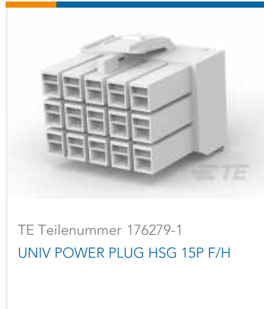
TE Teilenummer 176279-1 UNIV POWER PLUG HSG 15P F/H