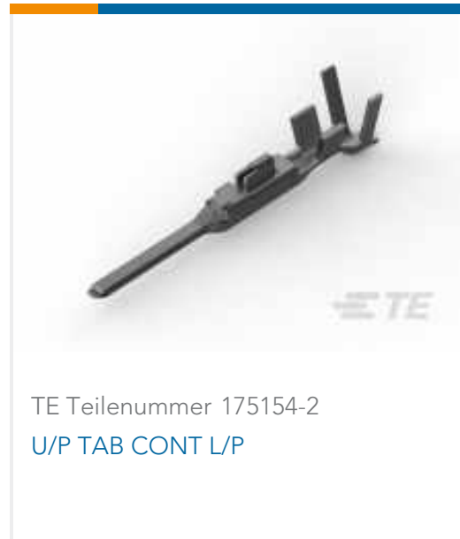
TE Teilenummer 175154-2 U/P TAB CONT L/P