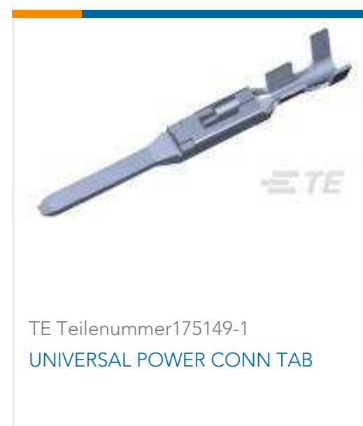
TE Teilenummer 175149-1 UNIVERSAL POWER CONN TAB