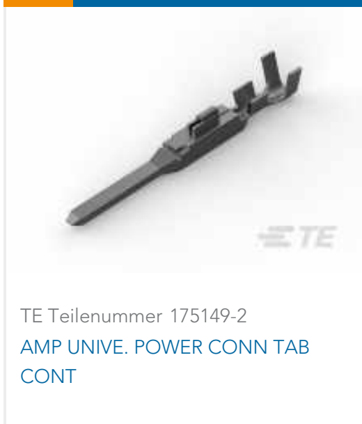
TE Teilenummer 175149-2 AMP UNIVE. POWER CONN TAB CONT