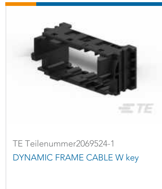
TE Teilenummer2069524-1 DYNAMIC FRAME CABLE W key