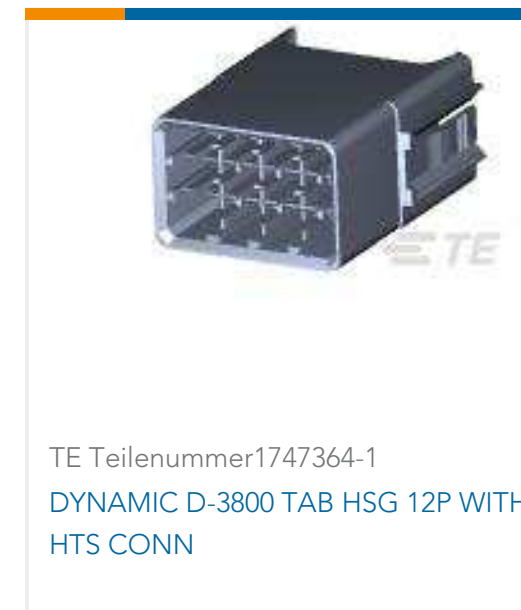
TE Teilenummer1747364-1 DYNAMIC D-3800 TAB HSG 12P WITH HTS CONN