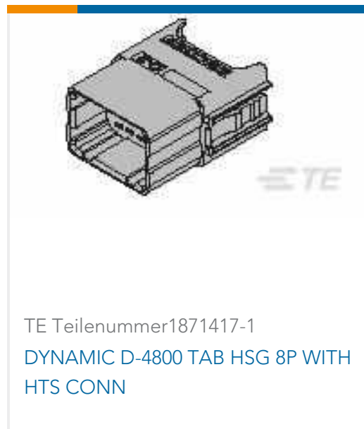
TE Teilenummer1871417-1 DYNAMIC D-4800 TAB HSG 8P WITH HTS CONN