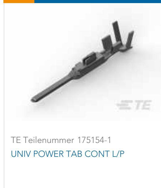
TE Teilenummer 175154-1 UNIV POWER TAB CONT L/P