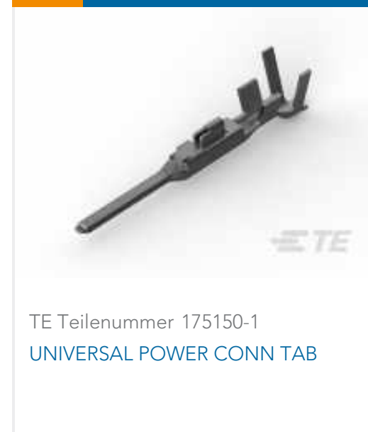
TE Teilenummer 175150-1 UNIVERSAL POWER CONN TAB