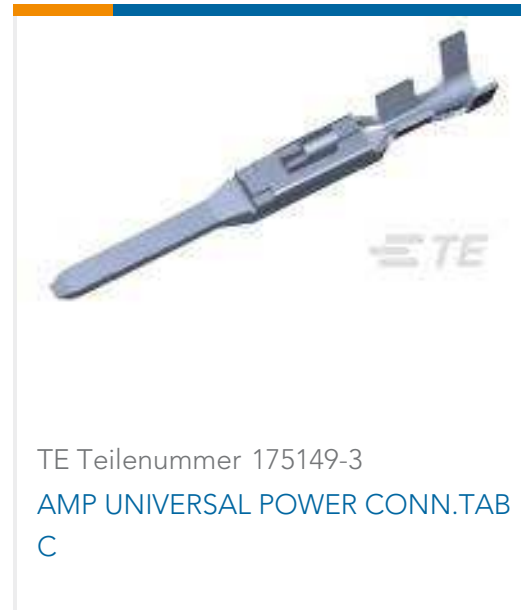
TE Teilenummer 175149-3 AMP UNIVERSAL POWER CONN.TAB C