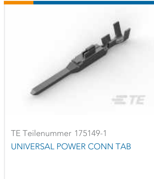
TE Teilenummer 175149-1 UNIVERSAL POWER CONN TAB