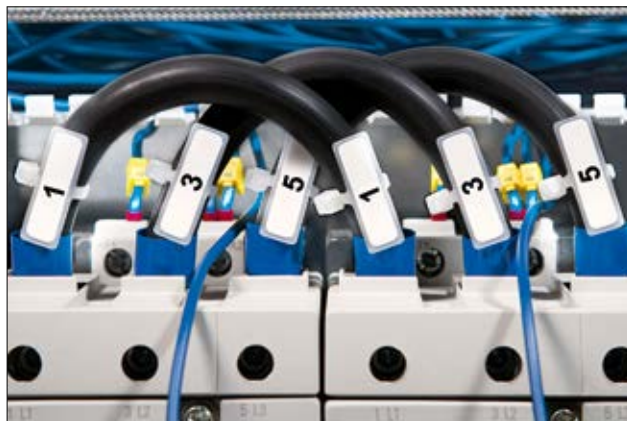
IT Kabelbinder – ein Arbeitsgang mit doppeltem Nutzen.

Passende Etiketten finden Sie auf Seite 496.