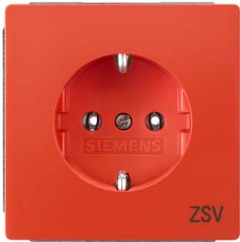
DELTA STYLE SCHUKO-STECKDOSE 10/16A 250V MIT AUFDRUCK ZSV ORANGE