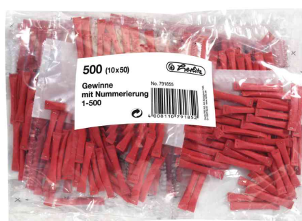
Billets-gagnants 1-500, rouge