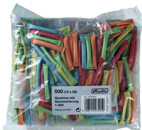
Billets-gagnants 1-500 (couleurs assorties)

Code. 791848001: pour le marché: D / L / A / CH