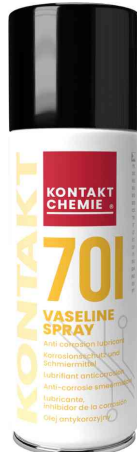
Schmiermittel "KONTAKT 701"