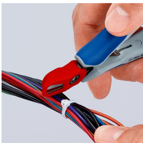
Semplice da fissare: il raccogliitore di materiale si attacca facilmente e tiene ben salda la testa della pinza

Con riserva di modifiche tecniche e salvo errori