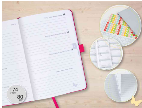
Visuel de référence : montre l'intérieur