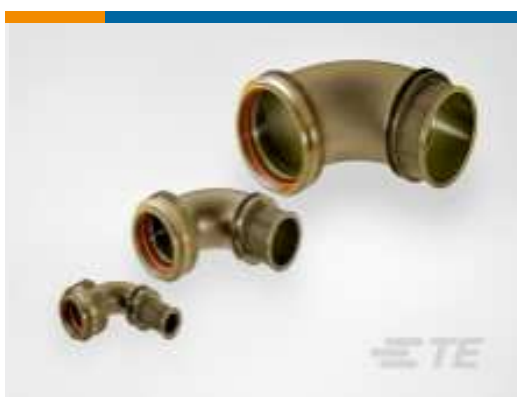
TE Teilnr.:BTA3-28-13-4-J BTA3-28-13-4-J