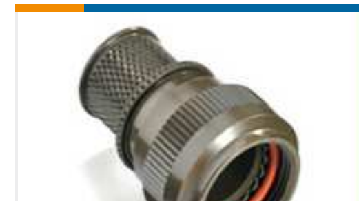
TE Teilnr.:BTA1-24-13-1-C BTA1-24-13-1-C