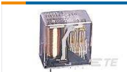
TE Teilnr.:3-1393812-4 V23054C2013B104