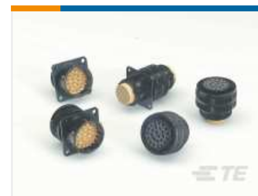
TE Teilnr.:ZPF000000000100155 FDBA 57-12-3 SN-K 090 A838