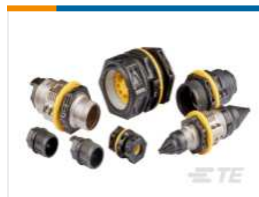
TE Teilnr.:ZPF000000000099321 D-EASY 03 B 03