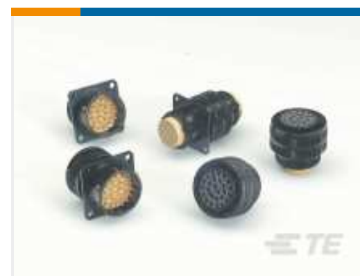
TE Teilnr.:ZPF000000000095953 FDBA 50-14-15 PN-K 090 A499