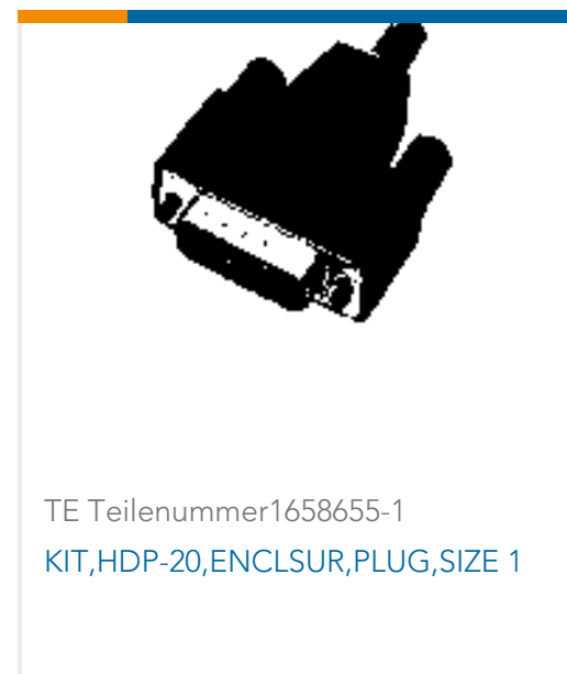
TE Teilenummer1658655-1 KIT,HDP-20,ENCLSUR,PLUG,SIZE 1