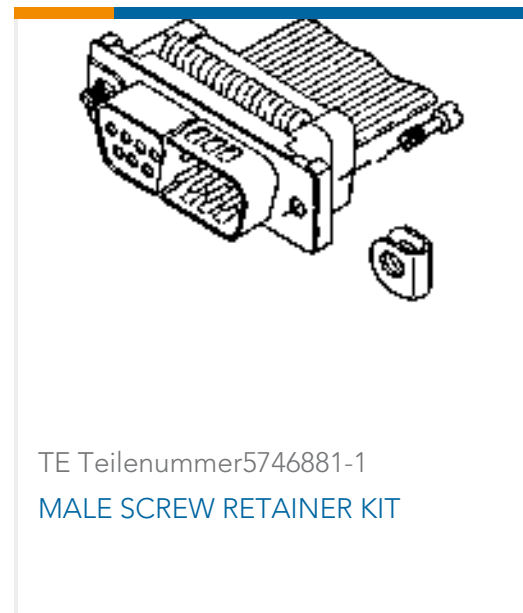
TE Teilenummer5746881-1 MALE SCREW RETAINER KIT