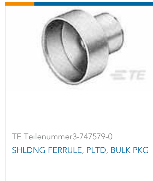
TE Teilenummer3-747579-0 SHLDNG FERRULE, PLTD, BULK PKG