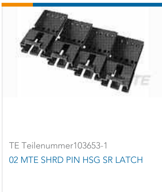
TE Teilenummer103653-1 02 MTE SHRD PIN HSG SR LATCH