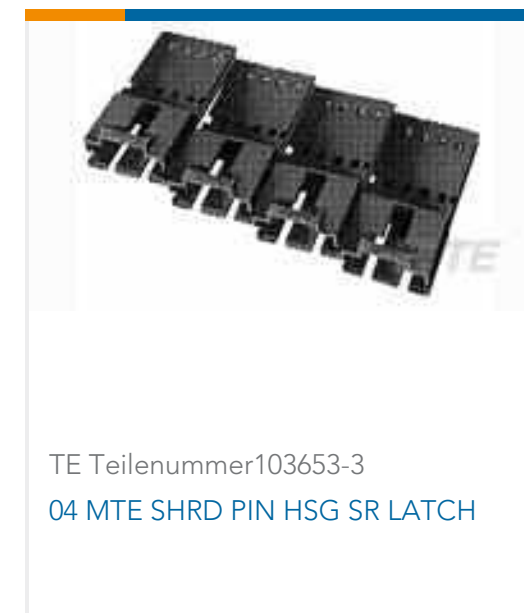
TE Teilenummer103653-3 04 MTE SHRD PIN HSG SR LATCH