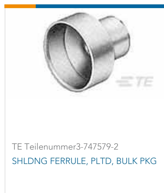
TE Teilenummer3-747579-2 SHLDNG FERRULE, PLTD, BULK PKG