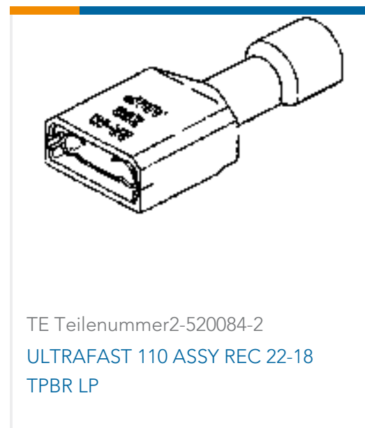
TE Teilenummer2-520084-2 ULTRAFast 110 ASSY REC 22-18 TPBR LP