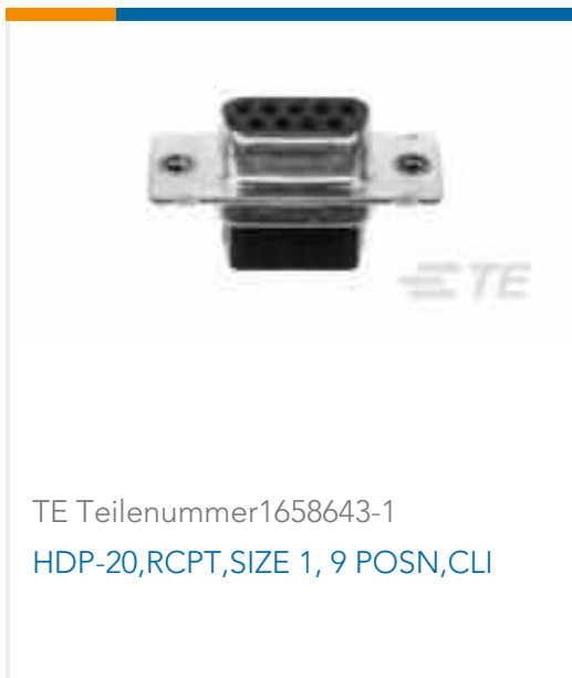
TE Teilenummer1658643-1 HDP-20,RCPT,SIZE 1, 9 POSN,CLI