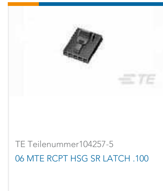
TE Teilenummer104257-5 06 MTE RCPT HSG SR LATCH .100