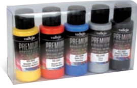
Ref. 62.103 Metallics Metalizados