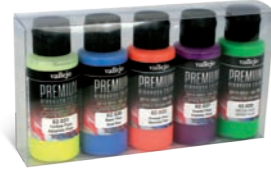
Ref. 62.102 Fluo Colors Colores Fluo