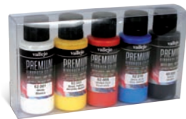
Ref. 62.101 Opaque Basics Básicos Opacos