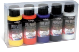
Ref. 62.104 Candy Colors Colores Transparentes

DE AV PREMIUM, spritzfertig die Airbrush angemischt, ist eine vielseitig verwendbare Farbe auf Wasser Base. Die Farben, für alle Oberflächen geeignet, sind giftfrei, nicht toxisch und speziell formuliert für eine hervorragende Haftung auf Metall, GFK, Polyethylen, klare Lexan Polycarbonat, Slot-Car und RC-Karosserien, und alle Tuning -und Auto-Grafik-Anwendungen. Für beste Ergebnisse auf schwierigen Untergründen empfehlen wir zuerst eine Grundschicht mit Polyurethan-Primer (62.061) aufzubringen. Premium-Farben sind flexibel und äußerst langlebig und verblassen auch nach längerer Zeit nicht; die Farben behalten ihre Leuchtkraft und Glanz auch bei Witterungseinflüssen.