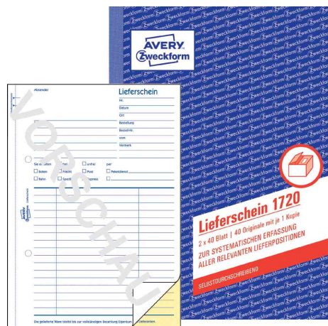
livre de formulaire (1730)