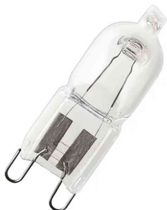
Visuel de référence: Ampoule de four HALOPIN OVEN