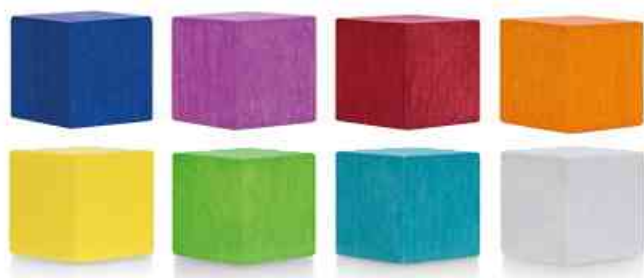
Aimant néodyme Wood Series Cube, couleurs intenses

- adhère magnétiquement aux tableaux blancs et autres surfaces ferreuses