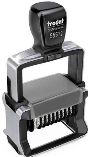
Ziffernstempel Professional 4.0 55512

Zubehör: Ersatzstempelkissen: auf Blisterkarte, Abgabe nur in ganzen VE's