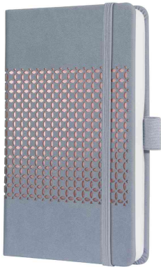
Taschenkalender Jolie Impress "Glacier Grey"