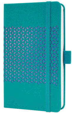
Taschenkalender Jolie Impress "Shimmering Seas"