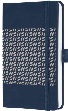
Taschenkalender Jolie Impress "Midnight Blue"