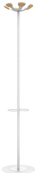
Portemanteau "AURORA", blanc