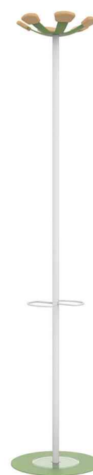
Portemanteau "AURORA", blanc / vert