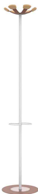
Portemanteau "AURORA", blanc / brique