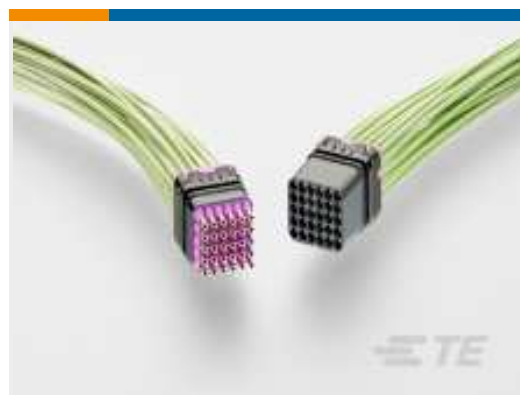
TE Teilnr.:ZPF000000000203398 DMC-Serie, hohe Dichte, 30-23 Kontaktnanordnung