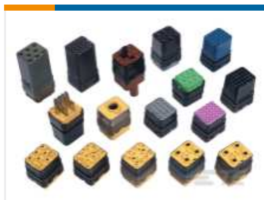
TE Teilnr.:ZPF000000000203708 DMC-M 99-10 PC