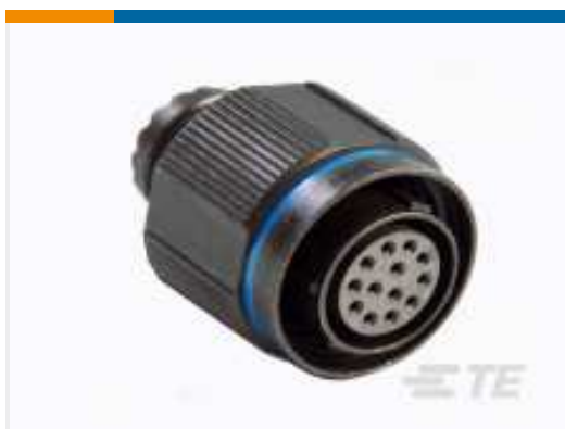
TE Teilnr.:YACT26JE35HNV00100 STRAIGHT PLUG