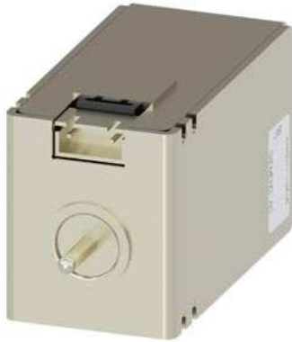
Unterspannungsauslöser UVR 240...250 V AC/DC Zubehör für Leistungsschalter 3WL10 / 3VA27