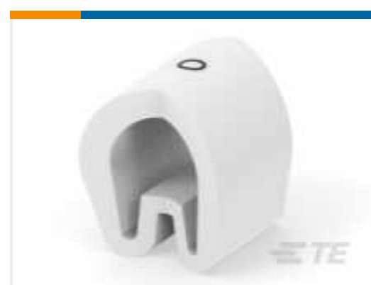
TE Teilnr.: EC5583-000 11543900