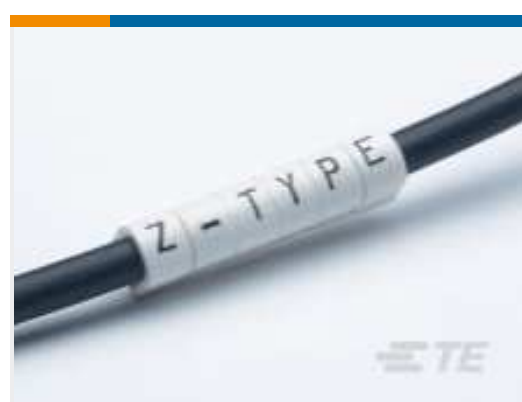
TE Teilnr.: CAT-T3437-Z1 Z-TYPE-AUFSCIEBMARKIERER