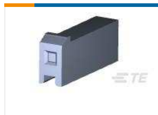
TE Teilnr.:640250-1 01P SL156 HSG W/LCK RAMP NATL