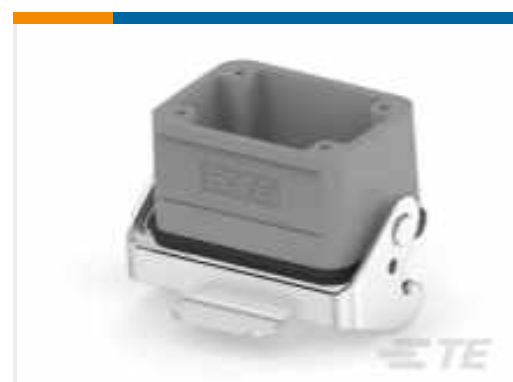
TE Teilnr.:T1730060000-000 H6B-TBF-T