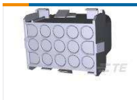
TE Teilnr.:1-480711-9 15P UMNL CAP HSG BLK