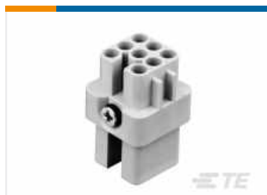
TE Teilnr.:T2020082201-000 HD-008-F