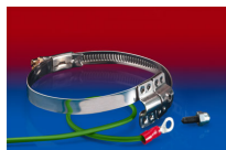
CLAMP 212 EC