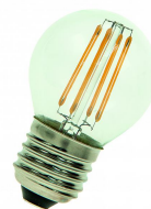
80100037331 LED FIL G45 E27 12V DC 3W (28W) 300lm 827 Clear