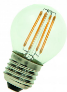
80100037256 LED FIL G45 E27 12V-24V AC/DC 3W (29W) 300lm 827 Clear