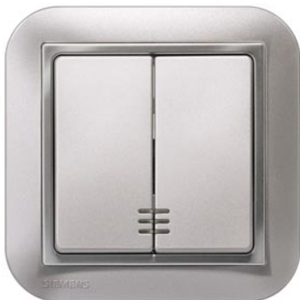
I-SYSTEM, ALUMINIUMMETAL. WIPPE MIT FENSTER F.SERIEN/DOPPEL-WECHSELSCHALTER 55X55MM