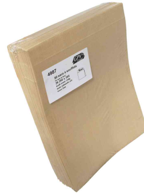
Symbolbid: Faltenversandtaschen fadenverstärkt - Großpackung