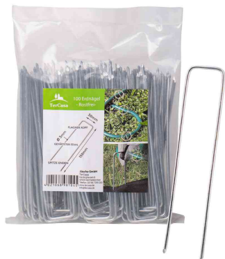
Piquet de fixation pour toile anti mauvaises herbes

- idéal aussi pour fixer des bâches, des câbles, des tuyaux, etc.