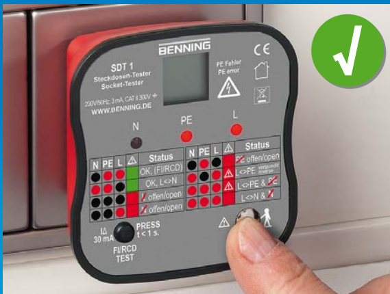
Steckdose korrekt installiert, Fingerkontakt prüft PE-Kontakt auf gefährliche Berührungsspannung.