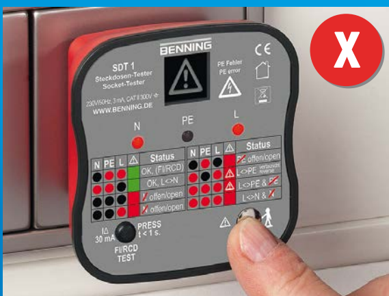
Steckdose mit Verdrahtungsfehler, Lebensgefahr! Außenleiter (L) und Schutzleiter (PE) wurden vertauscht!