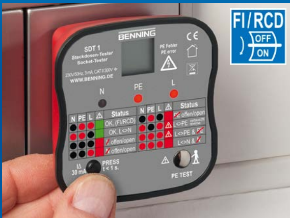
Prüfung der Auslösefunktion eines 30 mA FI/RCD-Schutzschalters durch Betätigung der Prüftaste.