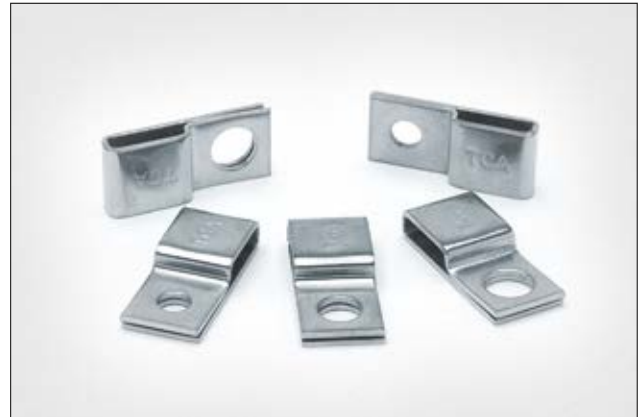
Edelstahlsockel der SSPC-Serie für Anwendungen in rauen Umgebungen.

i Die SSPC-Sockel sind ideal mit den MBT- auf Seite 86–92, MST- und MLT-Kabelbindern auf Seiten 93, 94 zu kombinieren.