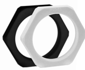
Typ KGM: Sechskantmutter, Kunststoff