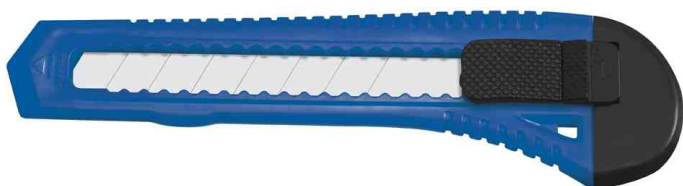
Cutter Office, 18 mm, blau / schwarz