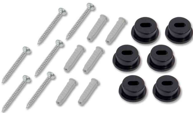
Wandhalterungs-Ersatz-Set artverum XL