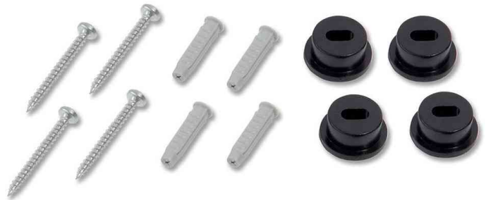
Wandhalterungs-Ersatz-Set artverum L