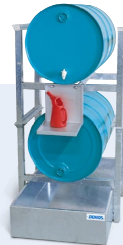
Fassregal Typ AWS 2, für 2 Fässer à 200 Liter, Bestell-Nr. 114-312-10