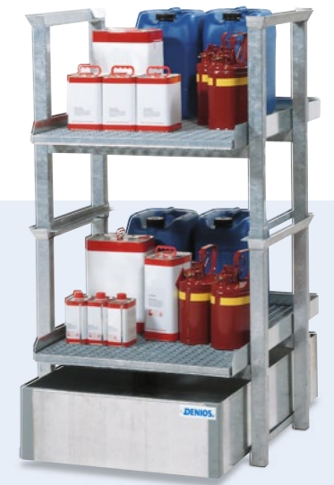
Kleingebinderegal Typ AWS 7, zum Abstellen von Kleingebinden, Bestell-Nr. 114-317-10