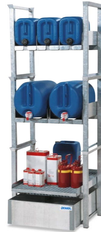
Kanister- und Kleingebinderegal Typ AWS 5, für 3 Kanister à 20 Liter und 2 Kanister à 60 Liter und Kleingebinde