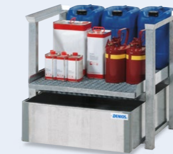
Kleingebinderegal Typ AWS 8, zum Abstellen von Kleingebinden, Bestell-Nr. 114-316-10