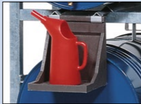
Kannenträger aus PE, Maße B x T x H (mm): 270 x 270 x 300, Bestell-Nr. 114-902-10