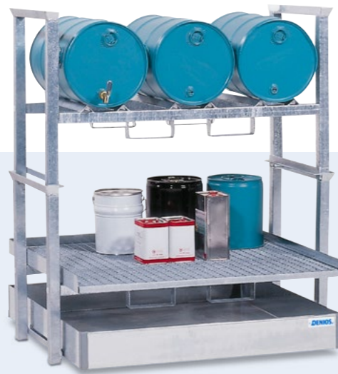
Fass- und Kleingebinderegal Typ AWS 4, für 3 Fässer à 60 Liter und Kleingebinde, Bestell-Nr. 114-306-10