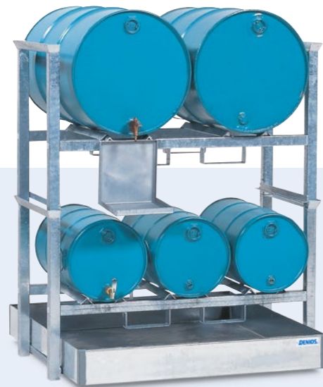
Fassregal Typ AWS 3, für 3 Fässer à 60 Liter und 2 Fässer à 200 Liter, inkl. Kannenträger aus Stahl, Bestell-Nr. 182-581-10