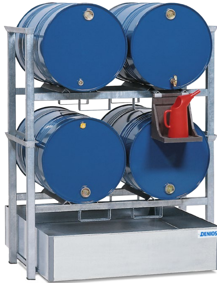
Fassregal Typ AWS 1, für 4 Fässer à 200 Liter, inkl. PE-Kannenträger