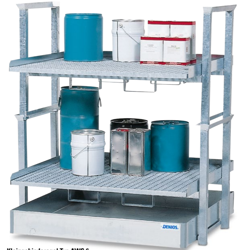
Kleingebinderegal Typ AWS 6, zum Abstellen von Kleingebinden