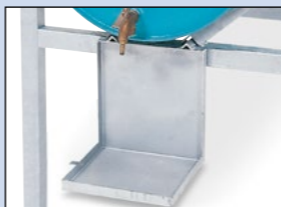
Kannenträger aus Stahl, Maße B x T x H (mm): 280 x 270 x 300, Bestell-Nr. 114-543-10